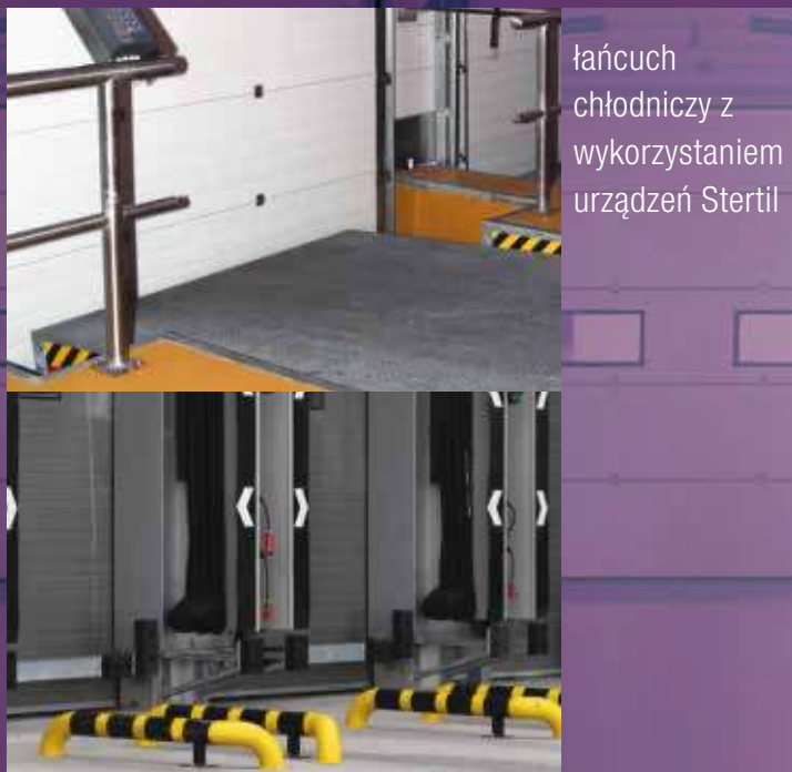
łańcuch chłodniczy z wykorzystaniem urządzeń Stertil